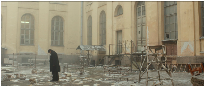
Рис. 6. Довлатов во дворе редакции среди рассыпанных рукописей. Кадр из фильма 31