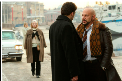
Рис. 7 б. Разрыв с предприимчивым профессором 36