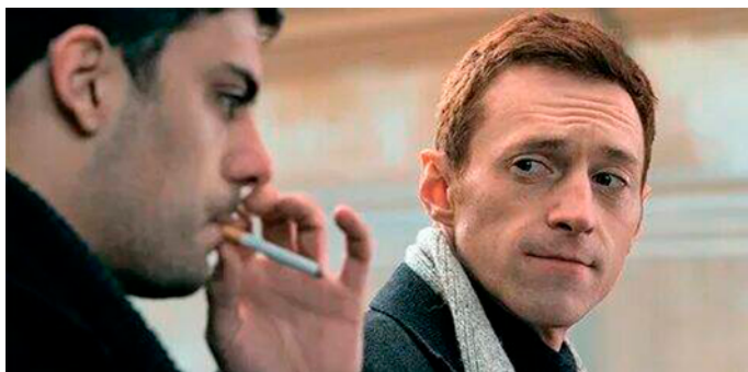
Рис. 4. «Довлатов» (2018). Сергей сообщает Бродскому, что «послал» редактора. Довлатов (акт. Милан Марич) и Иосиф Бродский (акт. Артур Бесчастный). Кадр из фильма 24

Из таких противоречивых мнений о главном герое следует, что в исполнении Марича — это личность как бы с «двойным дном»: внешне (по фабуле) — обаятельный красавец с пронизательным взглядом, ироничным складом ума и самолюбивым характером, но внутренне (по сюжету) противостоит конформизму и, в сравнении с окружением, — гений, некий сверхразум, записывающее сознание (рис. 4). А его контекст — застойный климат культурного Ленинграда 1970-х и разочарованное поколение новых «лишних людей» (Иванов, 2018).