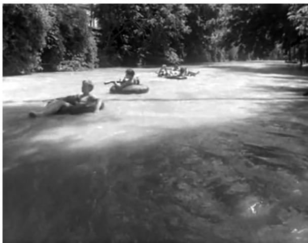
Рис. 2. Кадр из фильма «Нежность». Реж. Эльёр Ишмухамедов, 1966. Сплав мальчишек по реке Анхор в Ташкенте 2

победоносного социалистического труда. Несмотря на отступление Э. Ишмухамедова от канона соцреализма, и в «Нежности», и во «Влюбленных» можно выявить ряд мифологем: культ труда, героя и героизма, Революции, родной территории, Матери, восходящие к космогоническому мифу о сотворении мира. Наличие этих мифологем означает, что советский дискурс автоматически транслировался даже в таких внешне «неидеологизированных» фильмах.