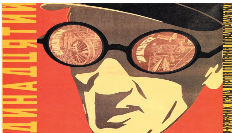
Рис. 1. Афиша художников В. и Г. Стенбергов к фильму Дзиги Вертова «Одиннадцатый» 1 Fig. 1. The poster of the artists V. and G. Stenbergs for the film The Eleventh Year by Dziga Vertov

надежды, из которых родился прорыв во всех видах искусства, называемый авангардом. Может быть, в кинематографе этот всплеск творческой энергии проявился наиболее ярко, обеспечив России на короткое время абсолютное первенство. Было открыто, что неприукрашенные лохмотья жизни могут быть высоким искусством. И тут же показано, как можно использовать осколки разбитого зеркала для внушения людям любых идей, но главное — надежды на новую жизнь. Десяти лет хватило, чтобы стало ясно — казавшееся вначале совпадение партийных и художественных интересов свелось к использованию творческих открытий для обслуживания утилитарных государственных потребностей.