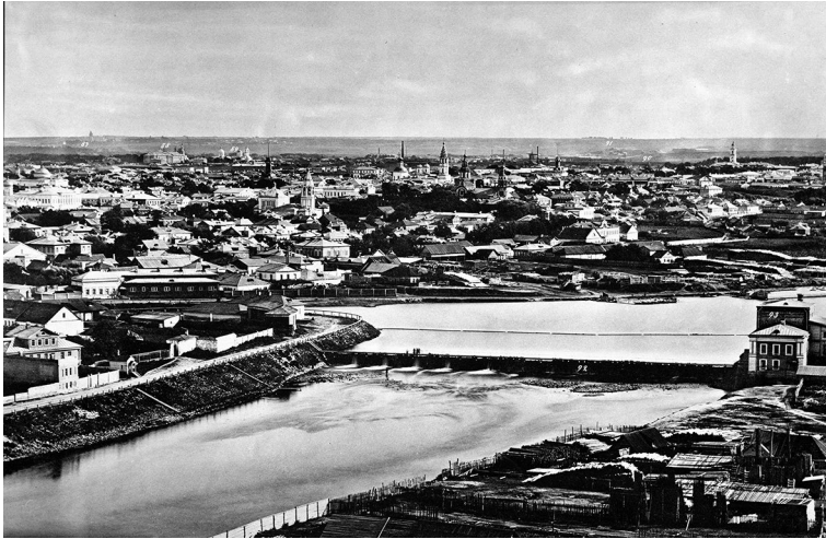
Рис. 4. Фотофирма «Шерер, Набоглиц и Ко». Лист № 14 «Панорамы города Москвы», созданной в 1867 году, представляет, как выглядела современная территория Крымской набережной во второй половине XIX столетия. Коллекция Государственного Русского музея