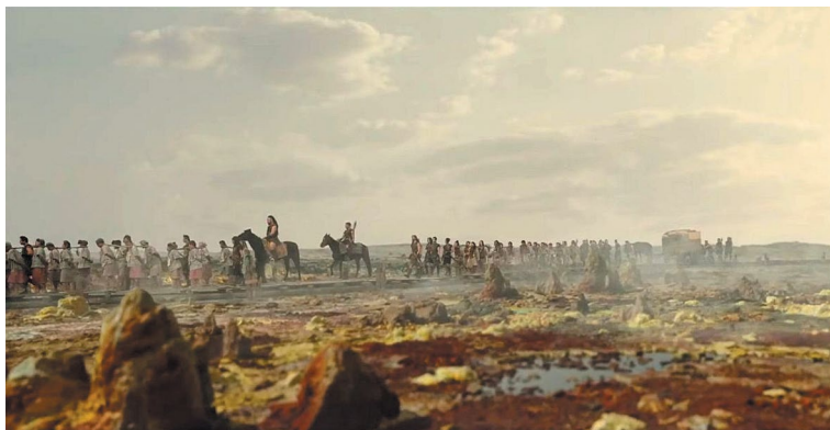
Рис. 6. Кадр из южнокорейского сериала в жанре фэнтези «Хроники Асдаля» (TvN, Netflix, 2019, сер.3) 5

ная разработка вымышленного мира. Были выделены художественные и технические приемы, позволившие создать подчиненное единой внутренней логике пространство, в котором разворачивается сюжет телеповествования.