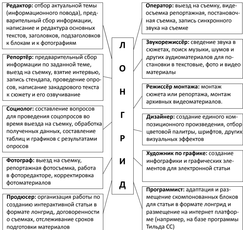
Рис. 1. Структура лонгрид по мультимедийным профессиям

ке экспертов, самые дорогие интерактивные статьи мира в один день становились популярными и востребованными читателями 8 .